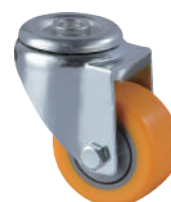
[ JZ-205-3S ]