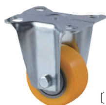
[ JZ-205-1R ]