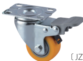
[ JZ-205-1H ]