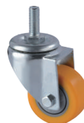
[ JZ-205-2S ]