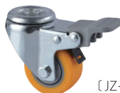
[ JZ-205-3H ]