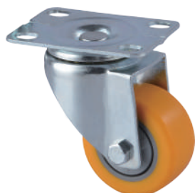
[ JZ-205-1S ]