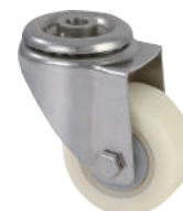
[ JZ-204-3S ]