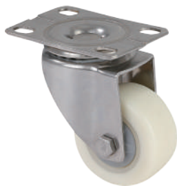
[ JZ-204-1S ]