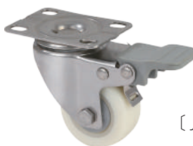
[ JZ-204-1H ]