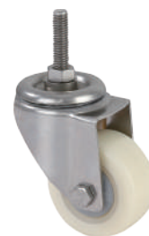
[ JZ-204-2S ]