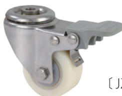
[ JZ-204-3H ]