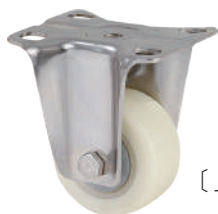
[ JZ-204-1R ]